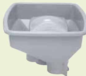
Tolva de introducción

De este modo, se puede realizar fácilmente un puré de gran calidad y sabor en gran cantidad.